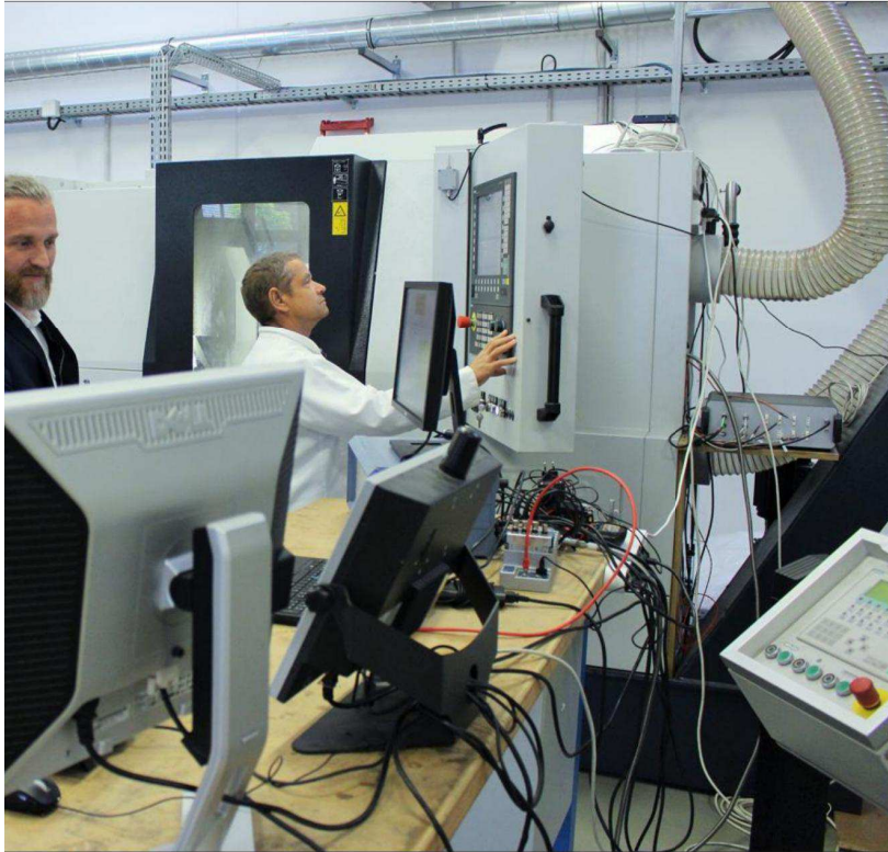
Le Centre européen de développement rapide de produit (Cirtes) est à l'initiative de la création d'une filière de fabrication additive (imprimante 3D) dans le Grand Est.