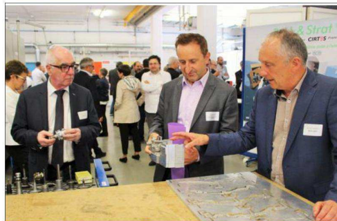
Le pôle véhicule du futur basé à Mulhouse a organisé une visite du Cirtes à Saint-Dié.

La technologie de l'impression 3D permet de créer des pièces sur-mesure, sans forcément avoir de moule. « Pour des pièces automobiles très spécifiques c'est fabuleux. Quand Peugeot nous demande de fabriquer une pièce qui n'a pas été usinée depuis quin-